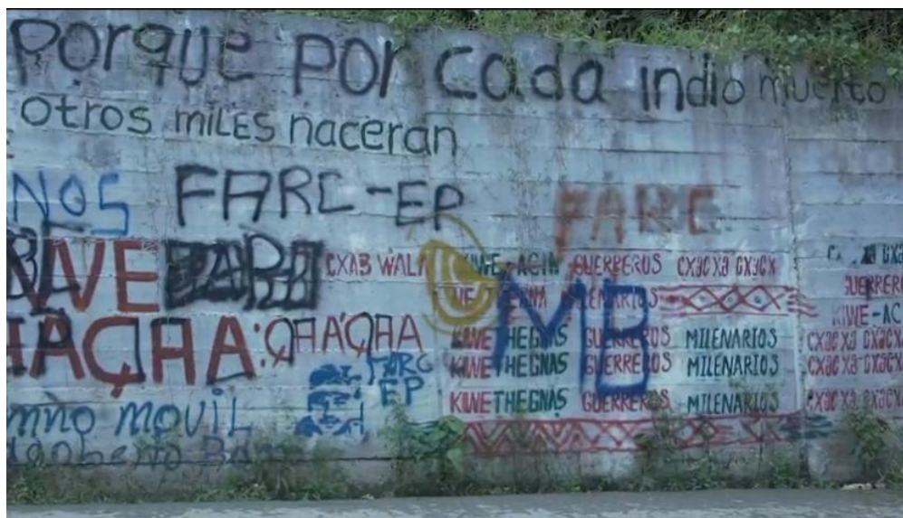
Figura 1. Muro de contención en la vía El Palo-Toribío. Municipio de Toribío, 15 de septiembre de 2022.

En los siglos anteriores, tales escrituras se asociaban con la práctica de los petroglifos. Es el caso de la Sath finxi kiwe , o ‘piedra escrita por los caciques’, expresión utilizada para referirse a una piedra grabada con decenas de petroglifos en la zona de Las Delicias (Cauca). La piedra sigue siendo considerada un espacio espiritualmente denso, en el que los médicos tradicionales acompañan periódicamente a miembros de la comunidad para compartir una lectura de la textualidad cristalizada en la roca. En época contemporánea, un papel similar se les atribuye a los grafitis, murales y otro tipo de intervenciones en el espacio público que conforman el PL actual de los resguardos nasa, en el Cauca colombiano. La difusión de dichas prácticas ha estado condicionada a algunas urgencias sociales provocadas por el conflicto armado interno colombiano. La progresiva aparición en el espacio público de firmas colectivas de grupos armados que operan en el territorio ha impulsado, entre distintos miembros y organizaciones de la comunidad nasa, la organización de actividades dirigidas a reafirmar la relación de exclusividad epistémica con el territorio, por medio del borramiento de grafitis de los grupos armados y de a intervención en el espacio público con signos multimodales de carácter oralitegráfico. De esta forma, el restablecimiento de las relaciones tradicionales de codificación con el entorno es asociado con nuevas memorias históricas de resistencia (cfr. Ferrari, 2020a).