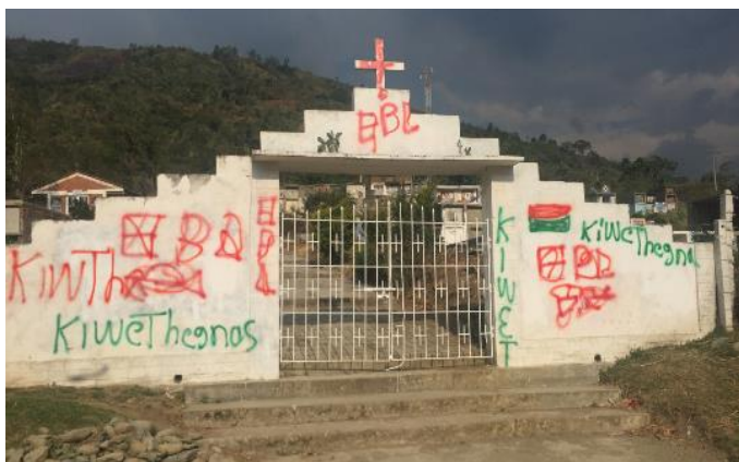
Figura 2. Cementerio de Toribío, 28 abril 2019