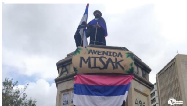
Figura 8.

Si, por un lado, dichas acciones pueden interpretarse en el contexto de la ola iconoclasta internacional y de la transformación de los espacios urbanos en “ciudades performativas” (Vargas Álvarez, 2022: 24) durante las movilizaciones colombianas de 2021, los actos de la comunidad misak se configuran, paralelamente, en el contexto de las renovadas percepciones epistémicas de su propio posicionamiento cultural, político y comunicativo en el territorio nacional. La horizontalidad radical (Rojas Sotelo, 2023) que subyace a estas prácticas reproduce una perspectiva de recuperación del espacio de existencia histórica y de las posibilidades enunciativas de la palabra comunitaria: es decir, una reapropiación del “territorio de lo imaginario” (Almendra, 2017). Bajo el