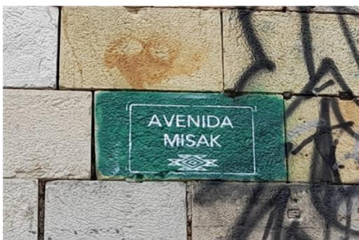
Figura 7.