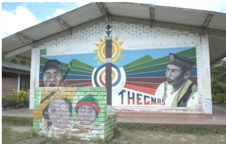
Figura 4. Pared del instituto educativo CECIDIC (Toribío), 16 de septiembre de 2022.