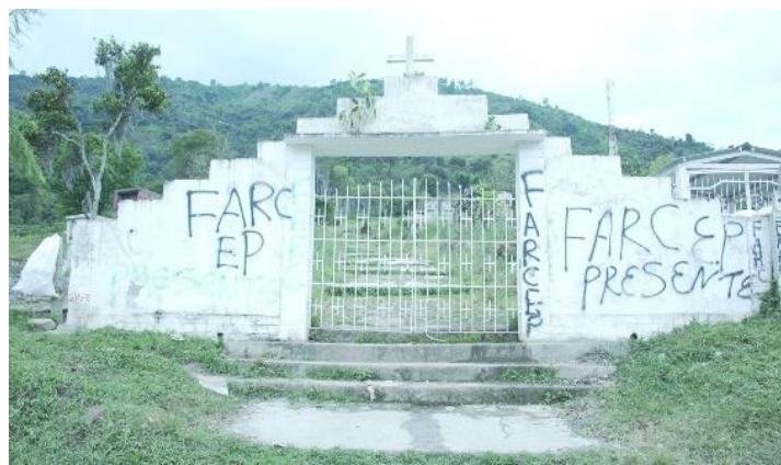
Figura 3. Cementerio de Toribío, 7 septiembre 2022