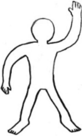
Figura 1. Patrón para la realización del retrato lingüístico (Busch, 2012: 511)

solicitó que los representaran en una silueta vacía (Figura 1) y con diferentes colores sin pensar en estas como categorías delimitadas o nacionales.