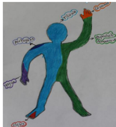
Figura 5. Retrato lingüístico de Pedro