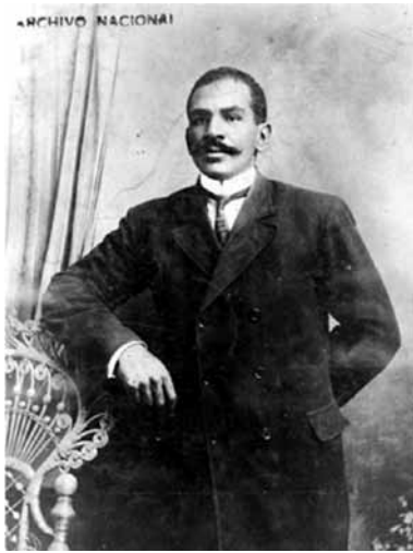
Evaristo Estenoz, 1872-1912