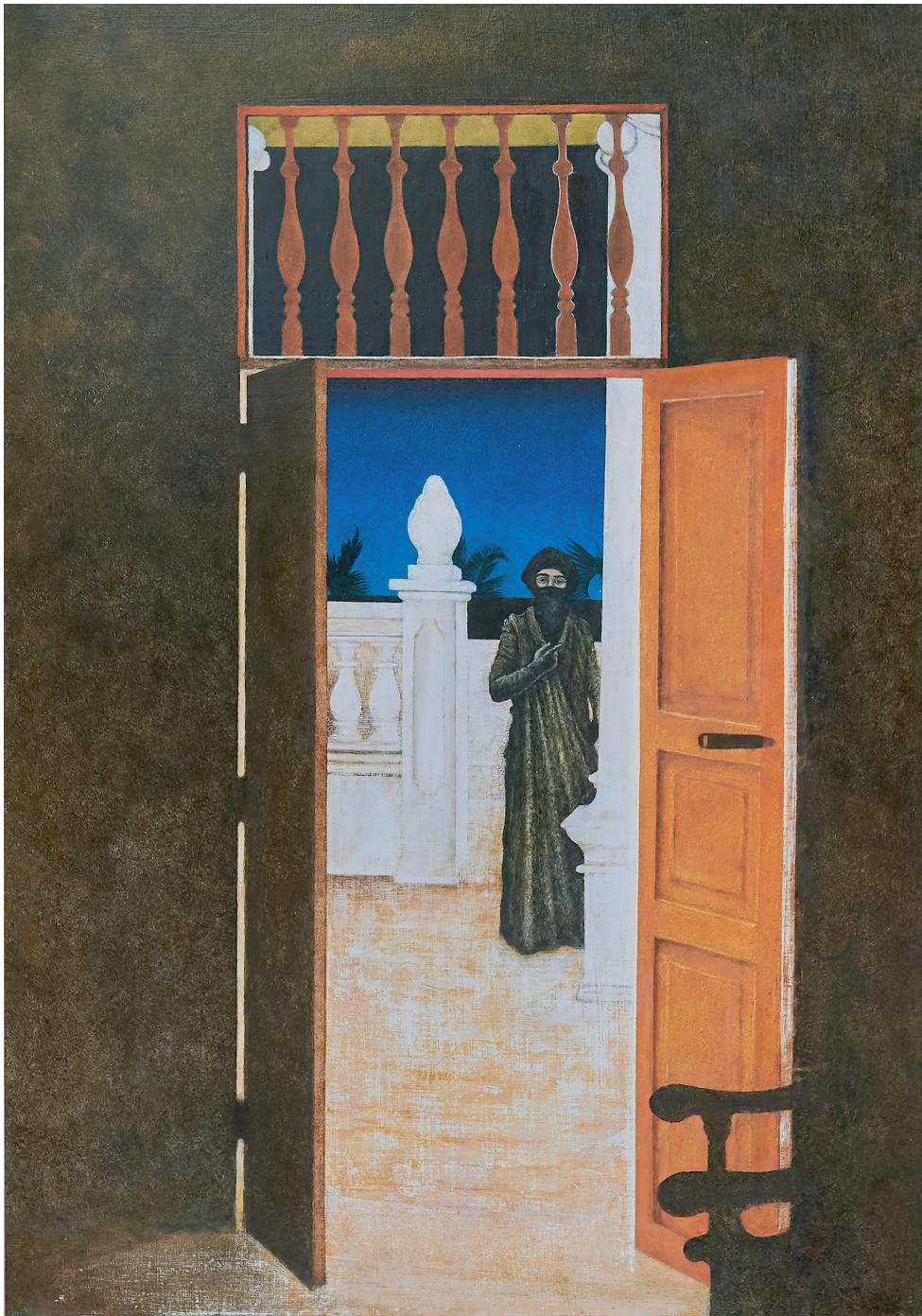
El visitante nocturno de Timothy Hall