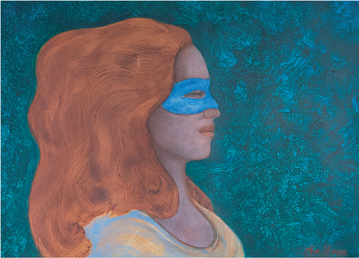
Rubia dorada de agua dulce de Timothy Hall