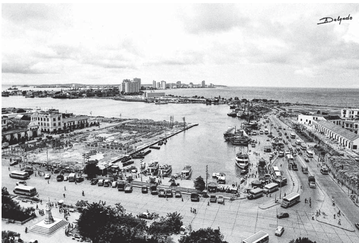
El mercado de Getsemaní ya demolido a principios de los 80, al fondo Bocagrande.

Cuando llegó estaba Modestico, el papá de Fanny, jugando dominó con Julián Oswaldo. Fanny, sentada hablando con su hermana Judith, le sonrió y le hizo seña con los ojos para que subiera. Juan la esperaba arriba. La casa de las Torres era de madera y tenía una segunda planta con dos balcones enrejados que daban hacia la calle Central. Cada vez que subía un escalón, se oía el traqueteo de la madera y María sentía que todo Sacramento la veía subir como si ella hiciera parte de