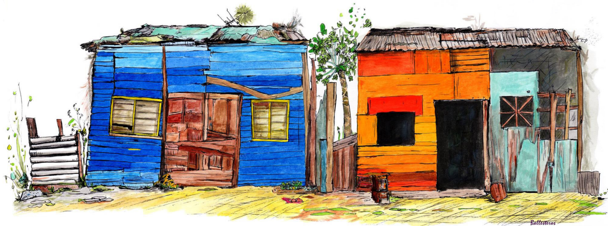
De la serie "Ciudad parapeto" (Raúl Ballesteros, 2016).

necesita ni de más leyes, ni de más foros, sino de voluntad política [...]”.