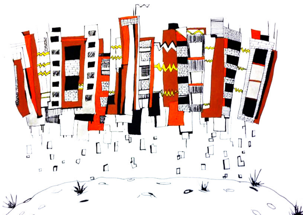
De la serie "Automáticos-dibujos en blanco" (Raúl Ballesteros, 2016).