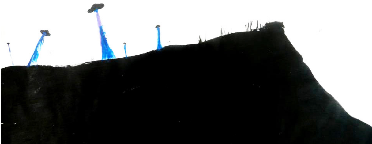
De la serie "Estudios sobre La Popa" (Raúl Ballesteros, 2013).

La UTRS es una unidad de negocio que busca producir ganancias para los cartageneros, bien sea de manera indirecta o directa, a través del empleo formal. Si ya existe una ley, lo siguiente es la voluntad política para integrar diversos actores, disciplinas y gremios, en busca de la organización productora de materias prima y de productos resultantes de máquinas e infraestructura transformadora de residuos sólidos aprovechables. Las máquinas necesitan operadores y esto genera empleo. La UTRS procederá a recoger los residuos separados y entregados en bolsa blanca, desde todas las unidades residenciales, domésticas, e inclusive algunas comerciales; mientras la separación específica y adecuación de los residuos para