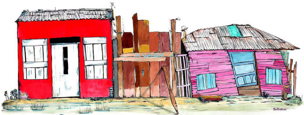
De la serie “Ciudad parapeto” (Raúl Ballesteros, 2016).

de ideas, participaron en el desarrollo de propuestas de integración ciudadana que estuvieran relacionadas con el reciclaje como negocio de triple beneficio, y se construyó la propuesta “Integración ciudadana en busca de transformación” (cf. Álvarez; Marrugo & Barrera, 2012). Actividad que involucró a los actores de un problema en la búsqueda de una solución. Esto en concordancia con los principios metodológicos de la Investigación Acción Participación (IAP). Los problemas psicosociales, como señala Balcázar (2003), sólo pueden desaparecer si se implementan intervenciones directas y se involucra a la comunidad que vive la situación. Así, en términos de Almaguer (2013), la importancia de los procesos de investigación de la metodología IAP –aunque generen resultados académicos y la descripción del procedimiento científico– radica en lograr un tipo de transformación concreta del entorno social y de sus actores participantes. A esto puede agregarse que los resultados académicos representan indicadores de gestión para las universidades, como centros generadores del conocimiento; mientras que la transformación social es un indicador de gestión pública, con inclusión y participación de la sociedad civil.