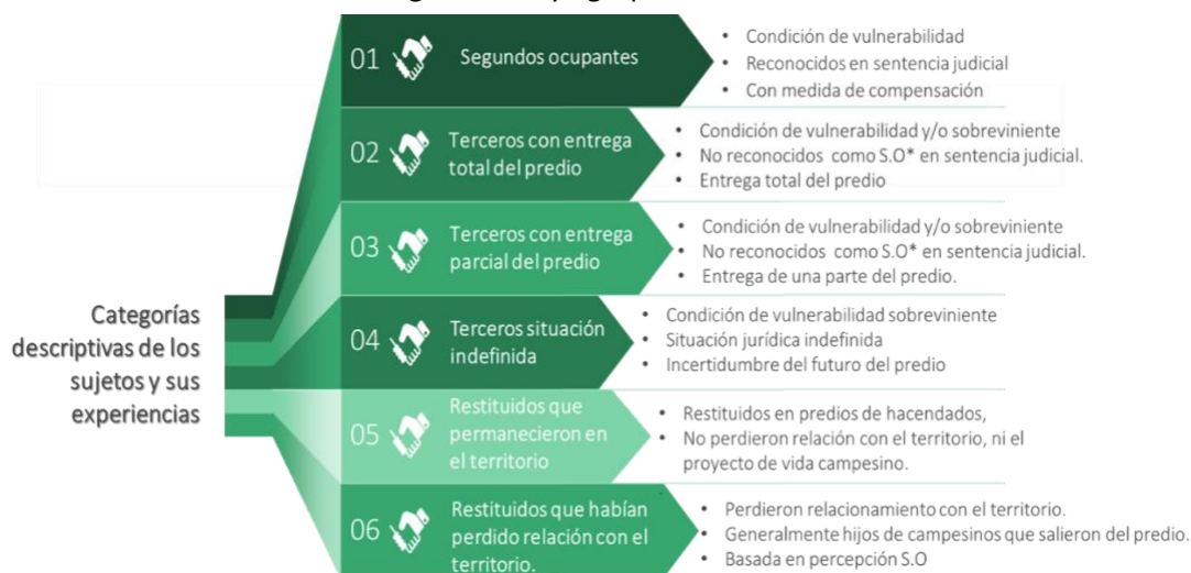
Ilustración 1. Categorización y agrupamiento de los casos de estudio

Los campesinos en ocupación secundaria manifestaron que, tras la restitución, los principales cambios en la comunidad se reflejaron en la fractura de las relaciones vecinales y las acciones de solidaridad, el debilitamiento del arraigo, las nuevas dinámicas con la llegada de diferentes personas al territorio, y el desarraigo resultado de la salida del territorio habitado. Los cambios se percibieron de manera diferente por los sujetos en cada caso trabajado, pues depende del desarrollo del proceso de restitución. Para facilitar la comprensión de los resultados, desde la investigación se decidió agrupar las experiencias en seis categorías de análisis de acuerdo la identificación jurídica y social, como se muestran en la siguiente ilustración: