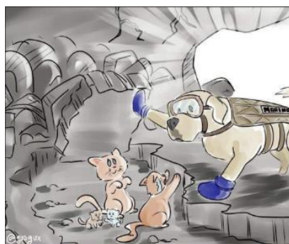
Figura 13. Dibujo de Frida por GarabuGus

No obstante, la mayoría insistimos, de las caricaturas y memes sobre canes rescatistas fueron alardes de cariño, solidaridad y afecto esperanzador entre animales y, sobre todo, hacia los humanos (figura 13, 14).