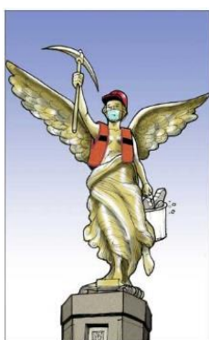
Figura 5. Nuevo ángel por Fisgón