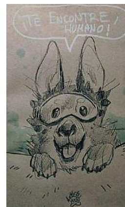
Figura 14. Dibujo por Miss Kanto