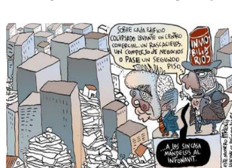
Figura 2. La moderna ciudad por Magú

http://www.laverdaddelcentro.com.mx/leer-20405-el-cartan-de-tiscarea-o-el-sismo-de-los-partidos.html (2017).