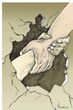
Figura 6. Solidaridad ante el sismo por Rocha