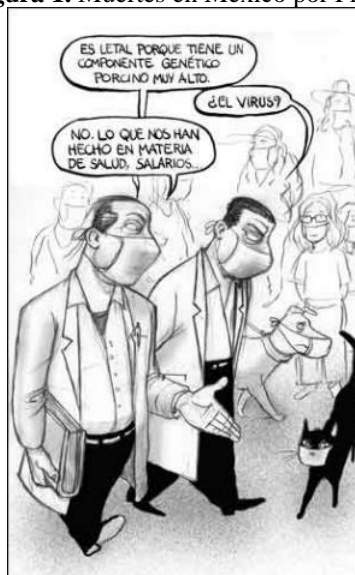
Figura 1. Muertes en México por Fígón