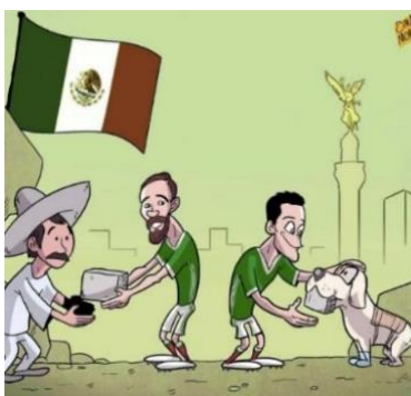
Figura 8. Mexico football stars help building the city after the earthquake por Omar Momani