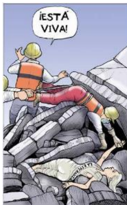
Figura 23. Aún respira por Fisgón