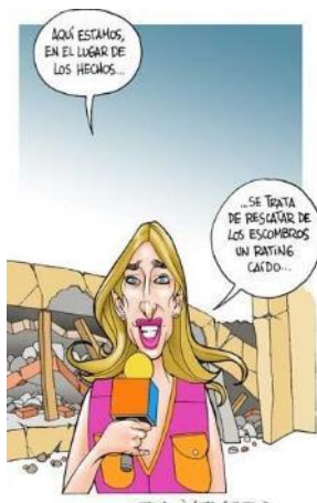
Figura 13. Infaltable por Helguera.