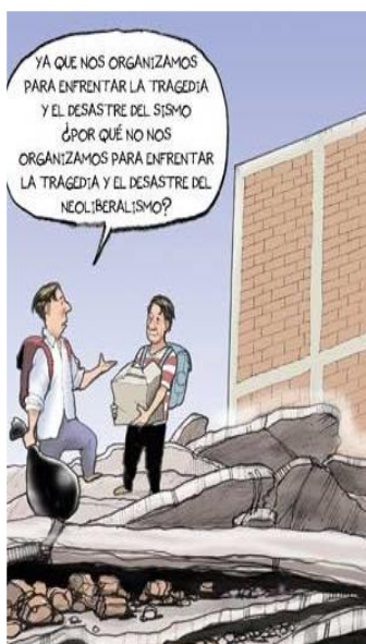
Figura 10. Simple pregunta por Fisgón