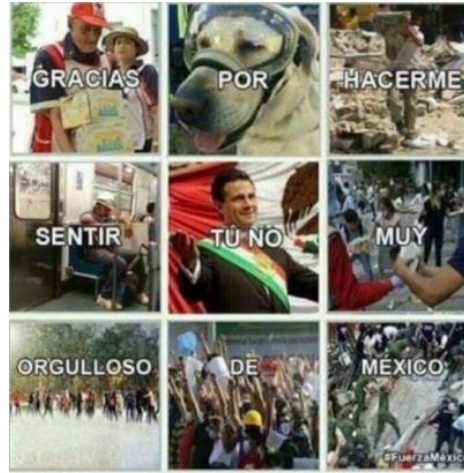
Figura 15. Meme que circulaba en redes sociales