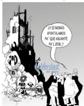
Figura 1. El sismo de los partidos por Tiscareño

Caricaturas y memes -expresiones de la cultura popular- crónica social, acontecimientos importantes, testimonios anónimos o firmados, ofrenda de amor y odio. Y es que en esos días en las calles y en las redes se trenzaron opiniones y emociones, no podía ser de otra manera ante la conmoción vivida en primera persona, la experiencia o conocimiento de la tragedia.