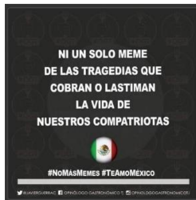
Figura 2. Imagen que solicitaba no hacer burla sobre las secuelas del sismo.

Ello en paralelo a algunos comunicados oficiales en el mismo sentido, sobre todo un llamado a la unidad, la ayuda ordenada y el no creer en la rumorología se hace eco en las redes.