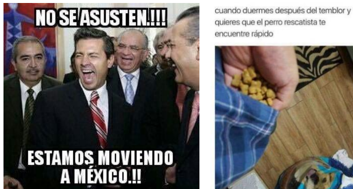
Figura 2. Memes que circulaban en las redes sociales

en la ciudad, al parecer por error. No podía faltar el meme de la importancia de llevar alimento canino como parte del kit básico ante un terremoto (figura 2).