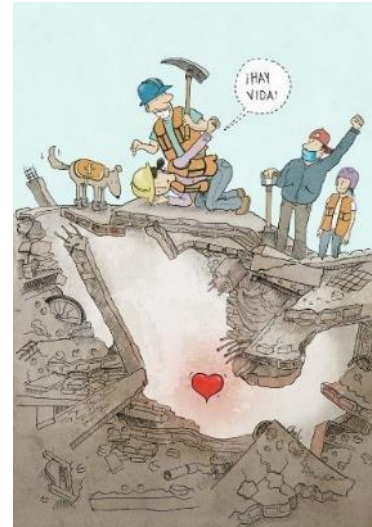
Figura 16. Solidaridad por Acelo Ruíz

http://eldeforma.com/2017/10/03/los-mejores-memes-y-reacciones-al-emoji-de-frida-la-perrita-rescatista/ (2017).