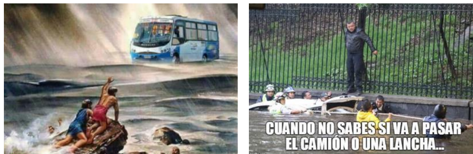
Figura 1. Memes sobre las inundaciones en la CDMX