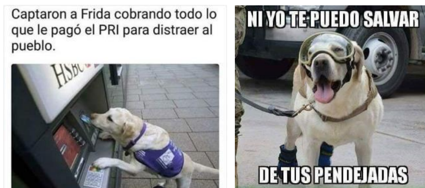
Figura 12. Memes sobre los perros rescatistas