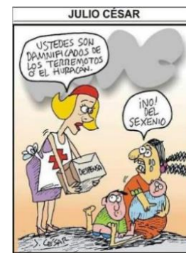
Figura 9. Cartón por Julio César