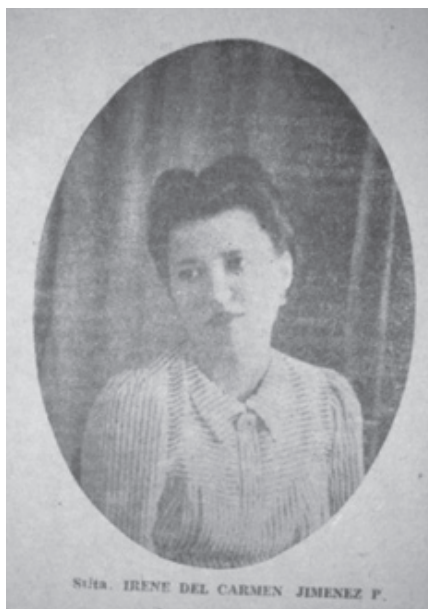
Figura 1. Fuente: AHC. Periodico El Figaro, Seccion Matrimonios. Cartagena 4 de enero de 1946.

serán utilizadas como un acercamiento a evidencias visuales. De la apariencia formal a la función simbólica, pasando por el testimonio documental de una condición social, la mujer es mostrada en la publicidad, para encarnar diversas metáforas que van a mostrar el ideal de lo que se desea de ellas (1995). En la prensa local de Cartagena, se difundió y expresó la construcción de imágenes y representaciones de las mujeres que tuvieron una importante expresión y trasmisión a lo largo del siglo XX.