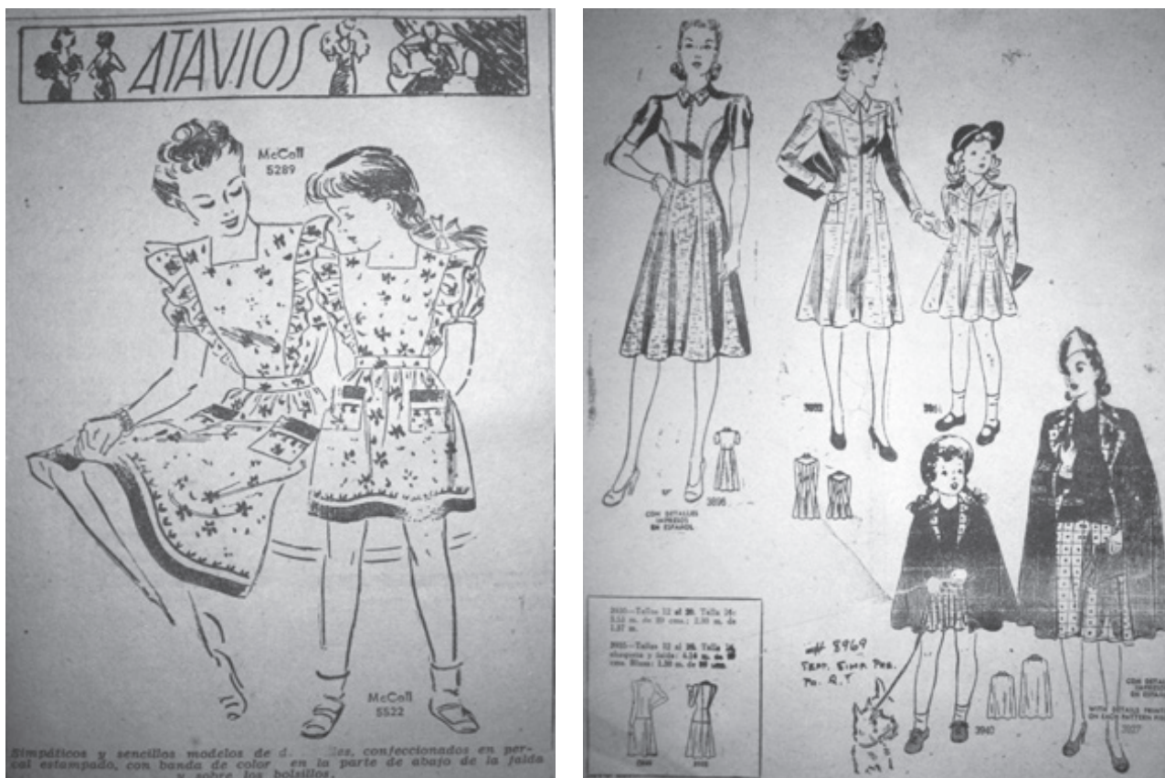
Figura 9 y 10.

seda, chales, permitían acentuar la diferencia de clase y establecer prácticas de identificación social. El vestido que se publicaba en la prensa denotaba diferencias de clase y edad (Domínguez, 1995: 111). En Cartagena de Indias, para la década de los 40's del siglo XX, la reproducción de imágenes femeninas acompañadas de sus hijas mostraba una manera de representar lo expuesto anteriormente.