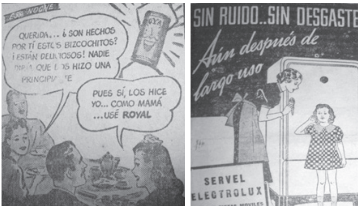
Figura 4 y 5.