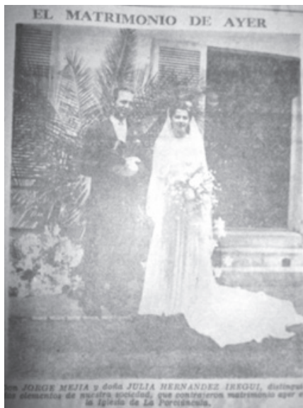
Figura 2.

Un aspecto importante para la prensa es mostrar la imagen de los matrimonios, pues están mostrando el rol de la esposa, un papel muy importante dentro de la sociedad Cartagenera. Los periódicos en su sección "matrimonios", revelan la belleza y la figura femenina, la cual ejercerá un rol importante para la vida de las mujeres, puesto que a partir de ahí se da la concepción de la crianza. La prensa muestra imágenes del matrimonio de la siguiente forma: