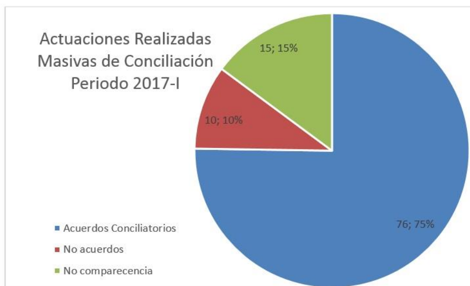
Figura 4. En cuento a las Conciliaciones realizadas en masivas de Conciliación, se puede ver que aun que se disminuyó la cantidad de solicitudes, para este periodo fue mayor el porcentaje de acuerdos es decir 75% se llegaron a un acta de conciliación del 100% de las solicitudes, donde nuevamente en comparación con el periodo 2016-I, la mayor barrera para llevar acabo las audiencias de conciliación, fue la no comparecencia de los convocados.

Figura 3 podemos observar cómo el 50% de las 44 solicitudes de conciliación que se iniciaron en la Oficina del Centro de Conciliación “Re-Conciliémonos” llegaron a un acuerdo que logro dar satisfacción a las partes convocadas en la mediación, en relación con el periodo 2016-I se puede ver que hubo una disminución de las solicitudes, pero también se puede evidenciar que el número de acuerdos en los dos periodos no varían en gran cantidad, máxime cuando en el primero periodo del 2016 fueron 26 acuerdos y en el primer periodo del 2017, fueron 22 acuerdos.