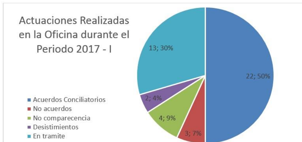
Figura 3 podemos observar cómo el 50% de las 44 solicitudes de conciliación que se iniciaron en la Oficina del Centro de Conciliación “Re-Conciliémonos” llegaron a un acuerdo que logro dar satisfacción a las partes convocadas en la mediación, en relación con el periodo 2016-I se puede ver que hubo una disminución de las solicitudes, pero también se puede evidenciar que el número de acuerdos en los dos periodos no varían en gran cantidad, máxime cuando en el primero periodo del 2016 fueron 26 acuerdos y en el primer periodo del 2017, fueron 22 acuerdos.