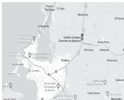
Mapa 1. Ubicación del cabildo indígena Zhandero de Bayunca (adaptación de Google maps).

El cabildo indígena Zhandero de Bayunca que está asentado en el corregimiento de Bayunca, a unos 30 kilómetros al noreste de Cartagena (ver Mapa 1).