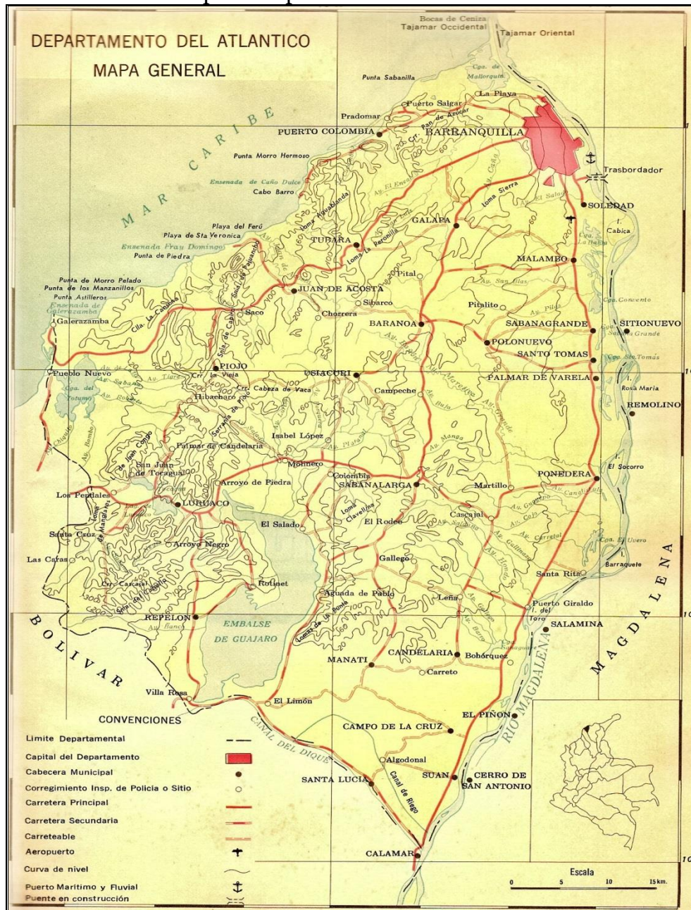
Mapa 6: Departamento del Atlántico