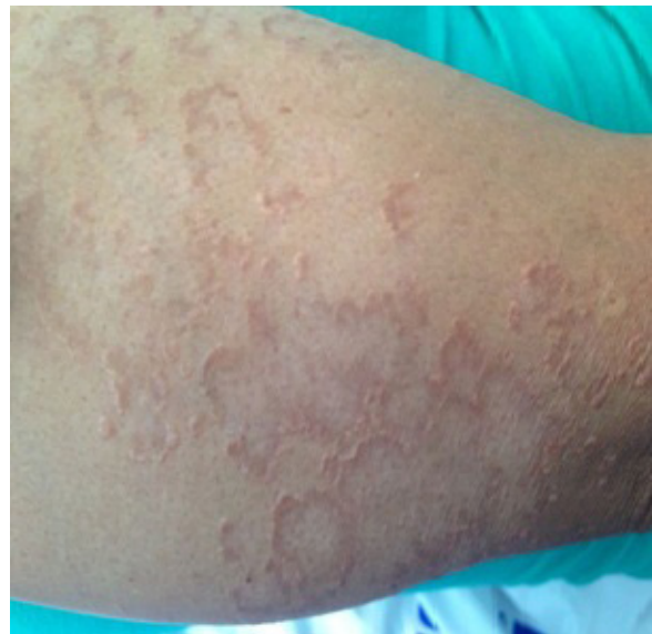
Figura N° 2. Placas anulares de bordes infiltrativos en extremidad superior.