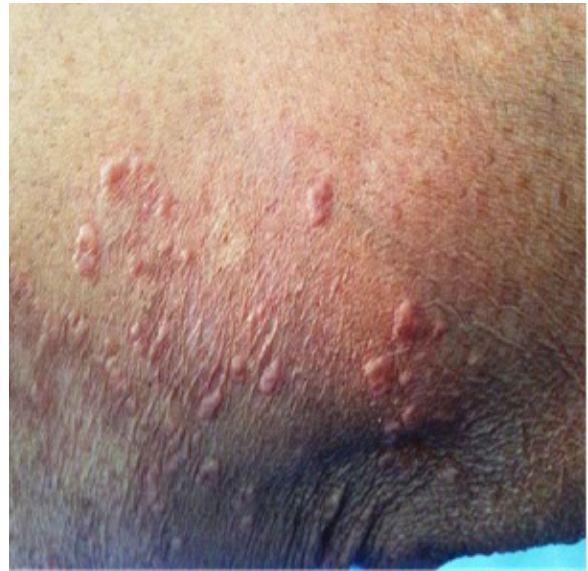
Figura N° 1. Lesiones en extremidad superior.

Ante la persistencia de las lesiones, consultó al servicio especializado de dermatología y se le encontraron placas anulares de 5 a 15 mm, con bordes infiltrativos, localizadas en áreas de exposición solar (Figuras N° 1, 2 y 3).