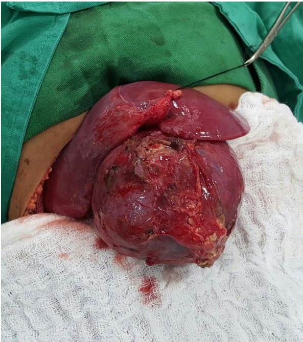
Figura N° 3. Tumor en su aspecto macroscópico y su relación con el hígado, previo a resección quirúrgica.