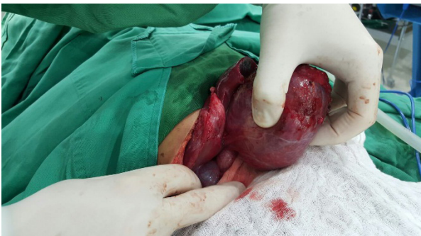
Figura N° 4. Maniobras de control vascular antes de la resección del tumor.