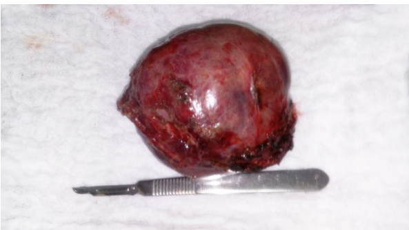
Figura N° 5. Resección completa de la masa.

Después de la administración de medios de contraste, las áreas sólidas pueden ser detectables fácilmente. El estudio de imagen de elección es la resonancia magnética (RMN). Para las lesiones con predominio del estroma, la intensidad de las imágenes en T1 es menor que la del hígado normal debido al aumento de la fibrosis. Por el contrario, si hay predominio quístico, la masa es predominantemente hipointensa en T1 y marcadamente hiperintensa en T2. Los componentes del estroma pueden mejorar después de la administración de gadolinio (6). Una biopsia abierta es a menudo necesaria para hacer el diagnóstico (7).