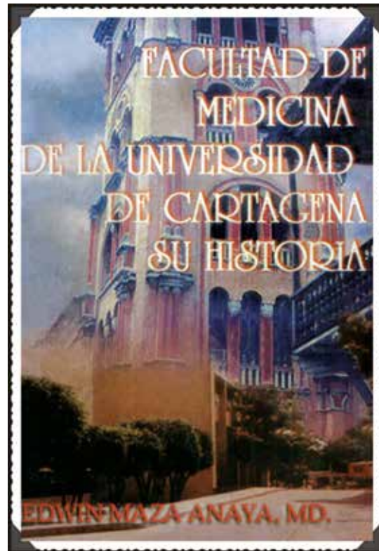
Portada del libro: "Facultad de Medicina de la Universidad de Cartagena: su historia".

También incursionó en la dirigencia gremial y académica nacional, siendo secretario (1979) y presidente (1992-1996) en la Sociedad Colombiana de Otorrinolaringología y cirugía de cabeza y cuello. Desde 1988 dio rienda a sus habilidades, dejándose abordar por las musas de las artes plásticas, espe-