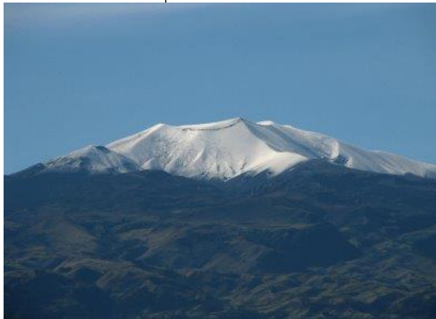
El Papá Señor: Volcán Puracé

Se encuentra conformado por las siguientes veredas: Patico, Hato Viejo, Veinte de Julio, Ambiró, Hispala, Chapío, Tabío, Pululó, Cuaré, Campamento, el Alto y Michabala, Patía y el centro poblado.