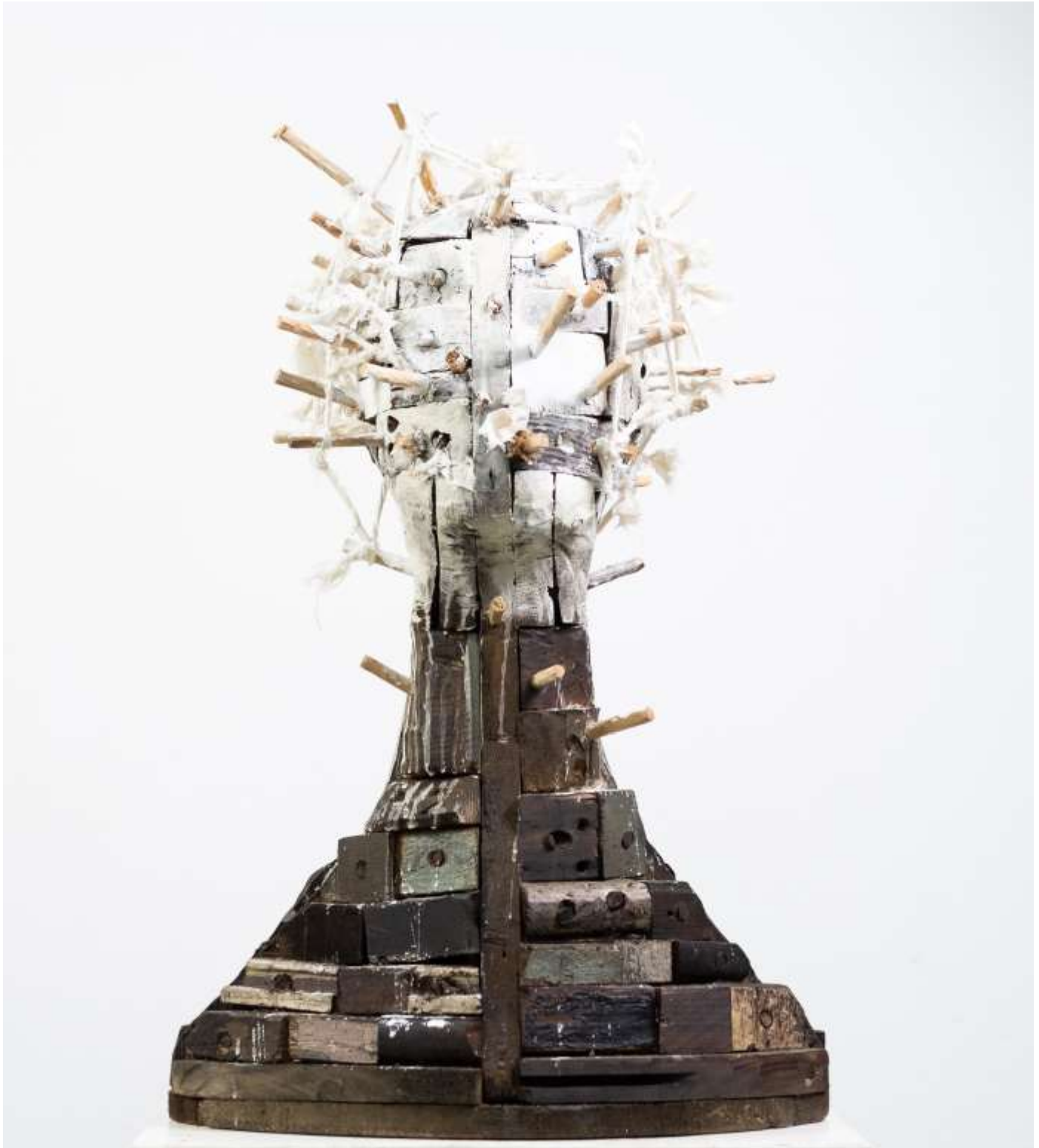
De la serie Edpiritu del viento, 2023, Madera quemada ensamblada, 69 x 43 x 38 cm