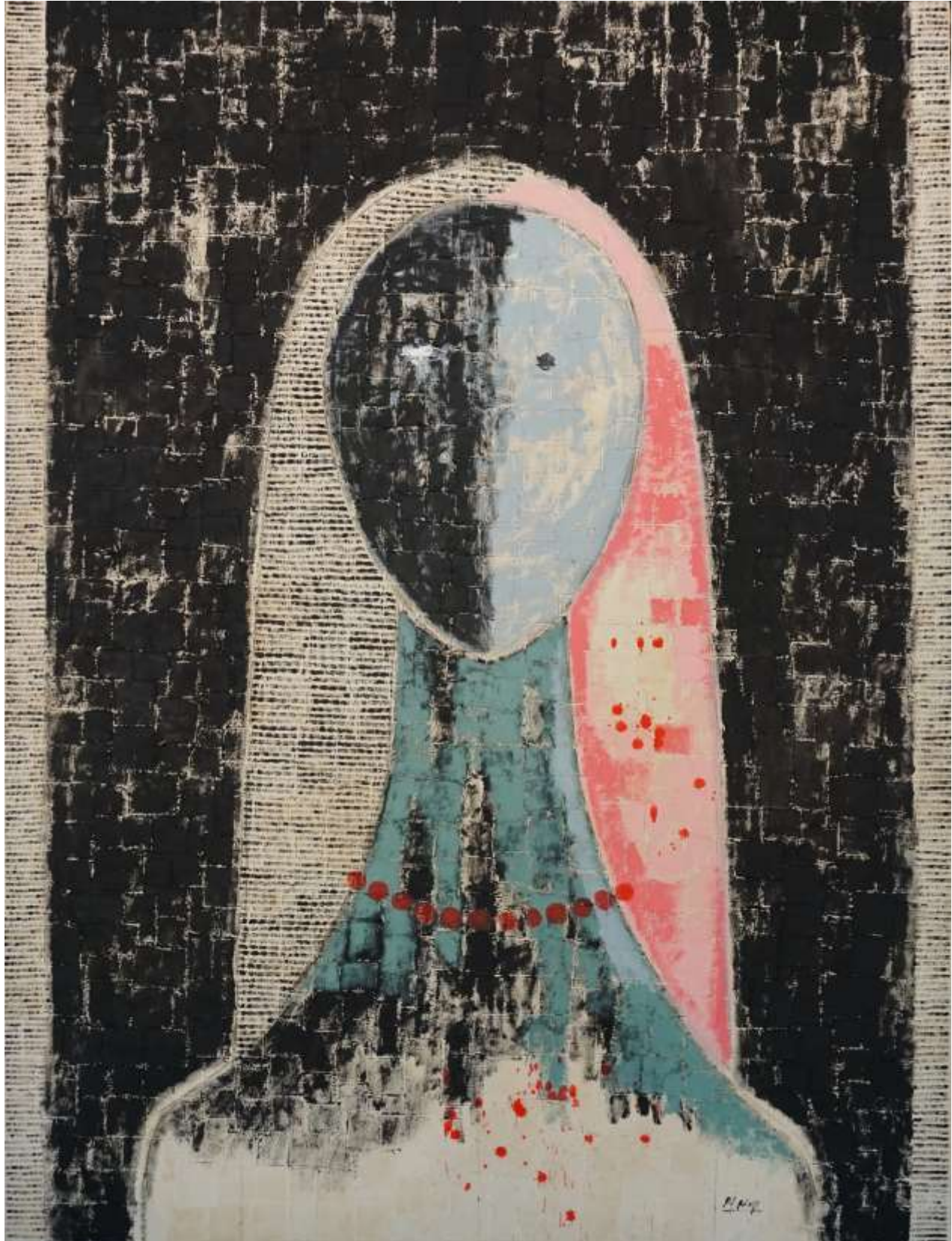
S-T, 2024, Mixta-Tela, 200 x 150 cm