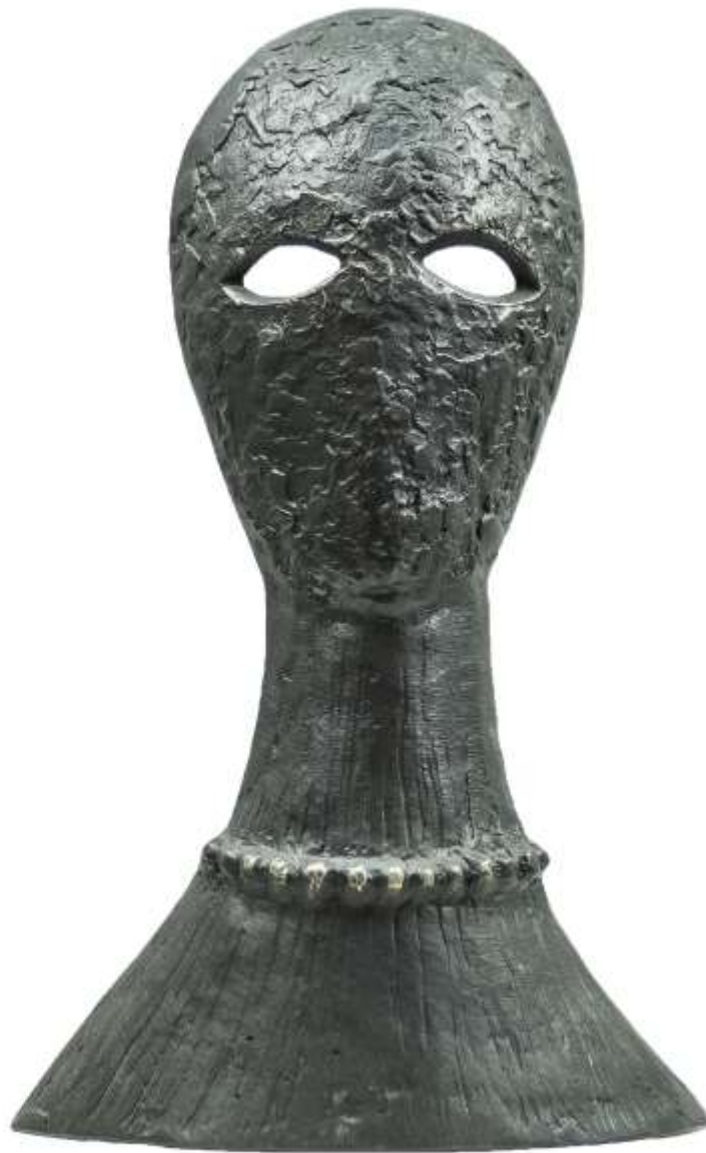
S-T, 2021, Bronce, 31 x 17 x 8 cm