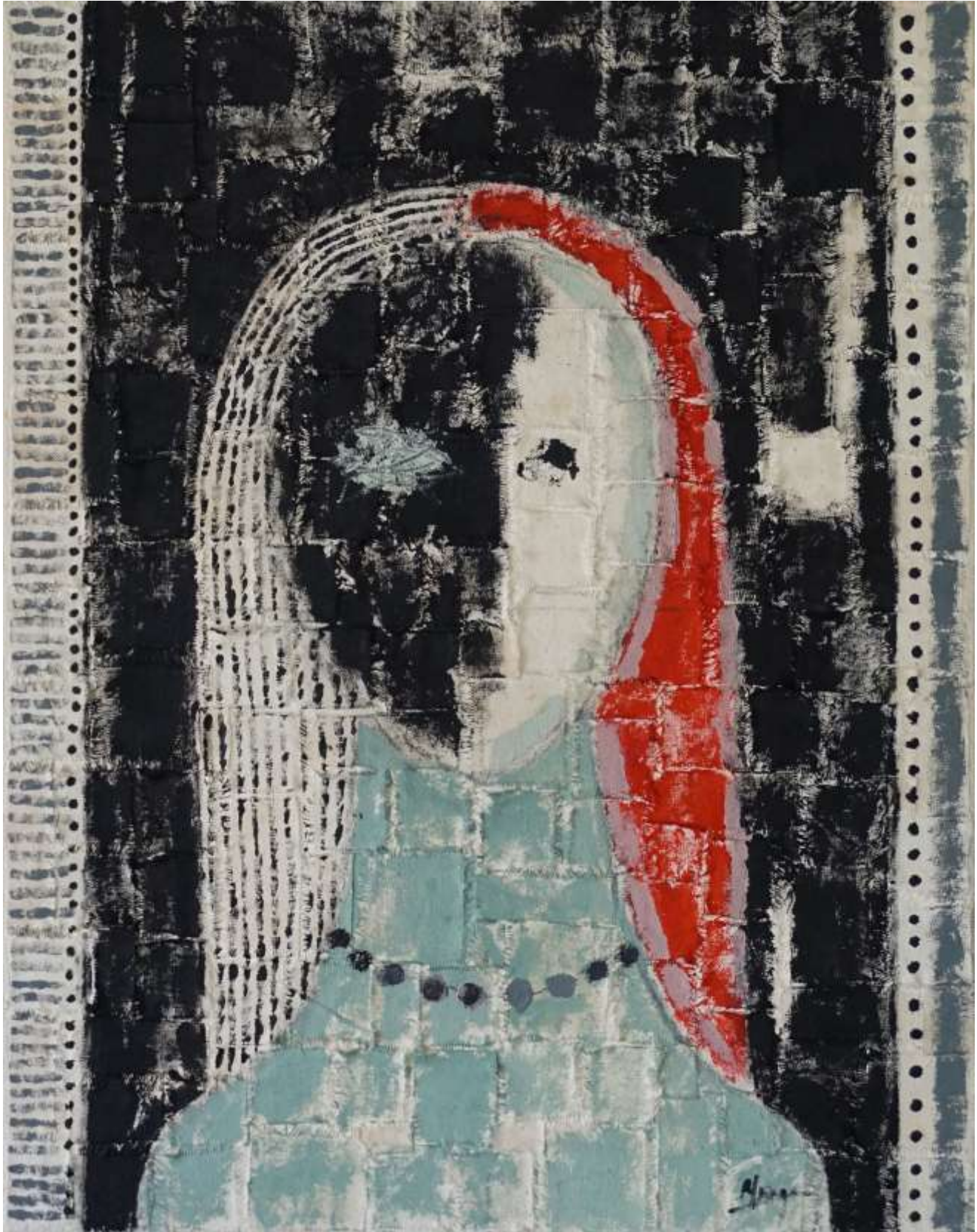
S-T, 2024, Mixta-Tela, 46 x 36 cm