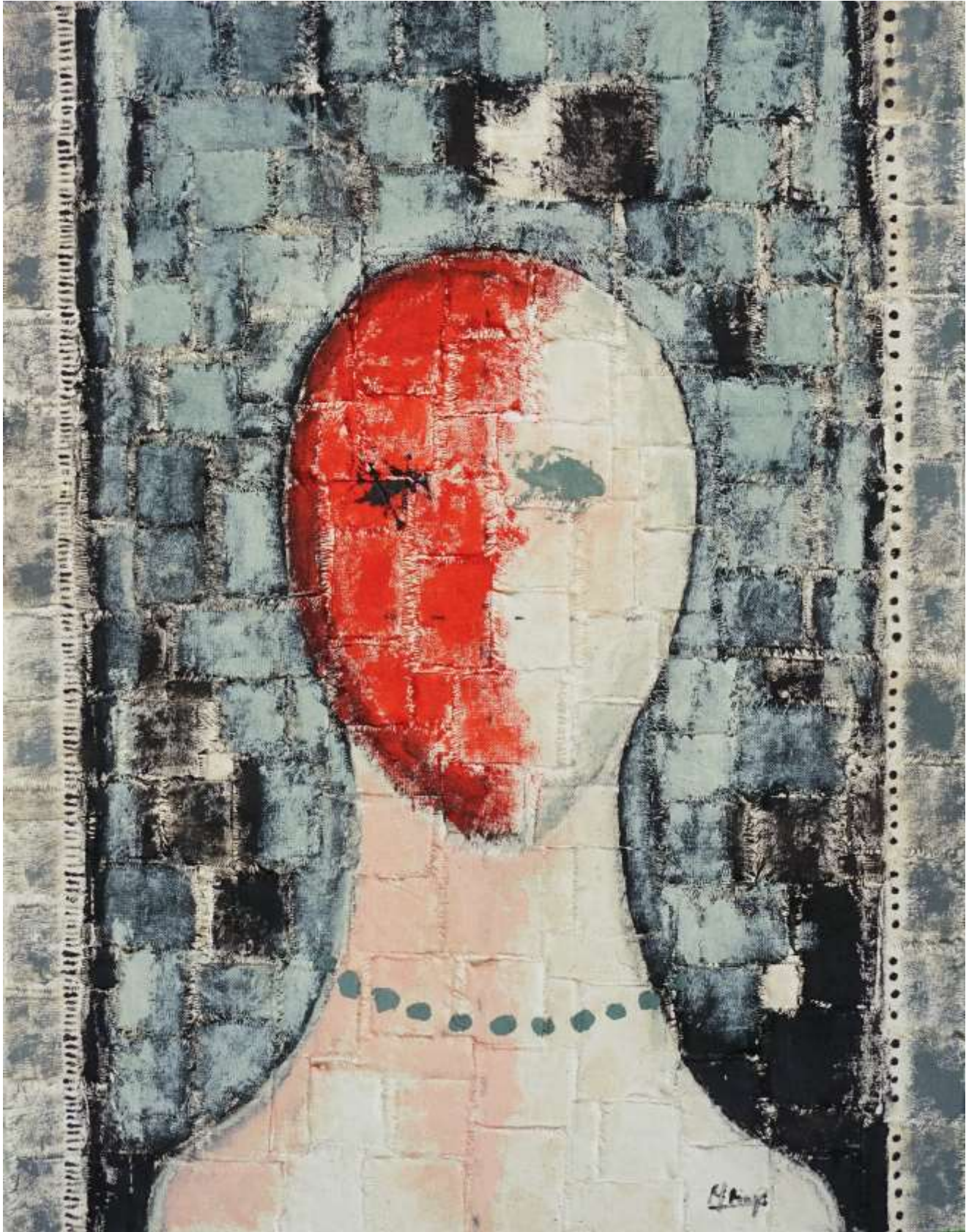
S-T, 2024, Mixta-Tela, 46 x 36 cm