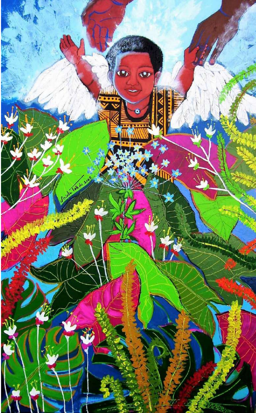
Regresando al paraíso, 2008 © (Serie Pura Diversidad: Divinidades y Religiones).