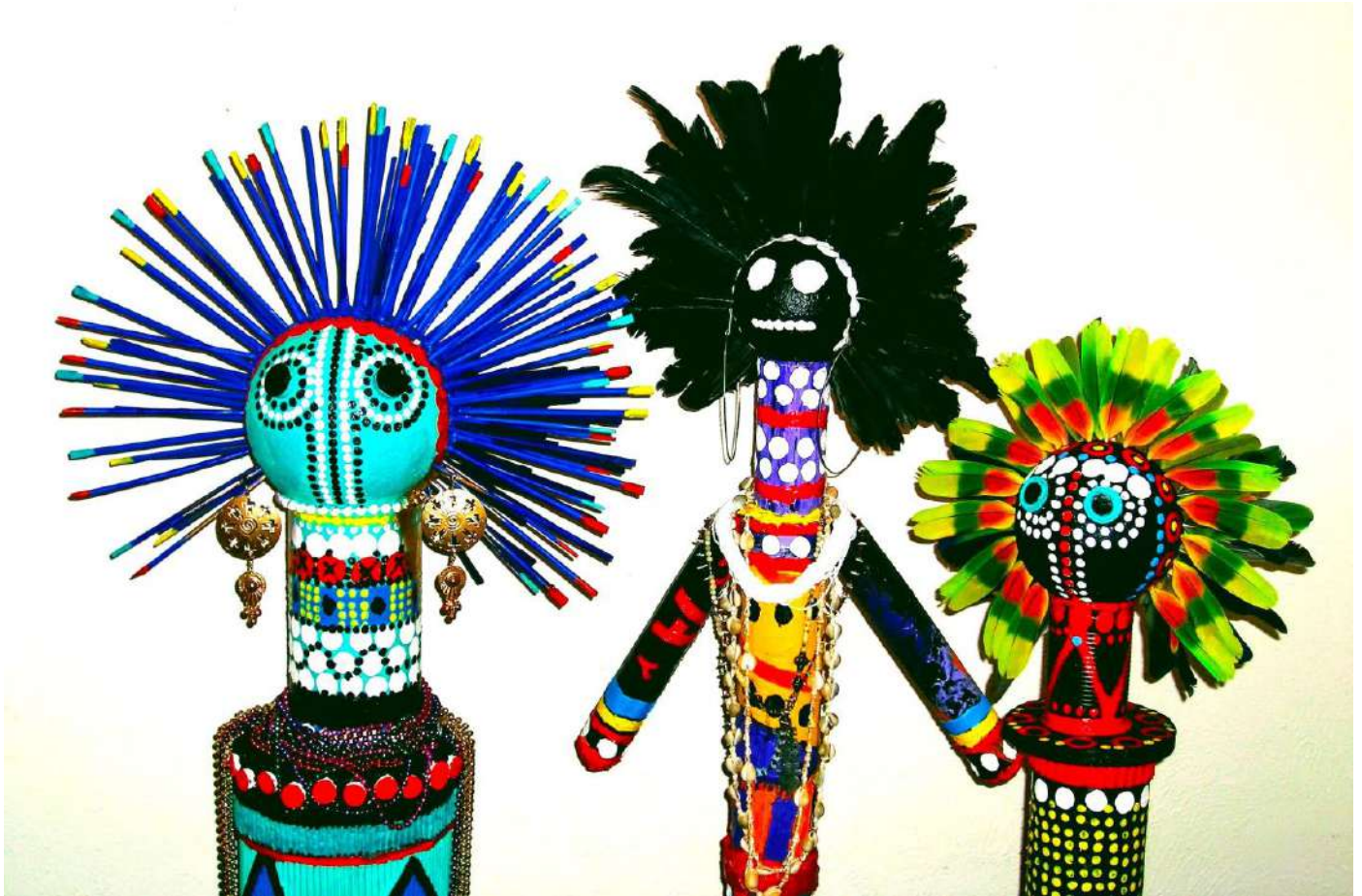
Muñecas Zulú 2004 © (Serie Pura Diversidad: Niñez y Juguetes). Esculturas de técnica mixta. (Izq. a derecha: 210, 170 y 195 cm. de altura)