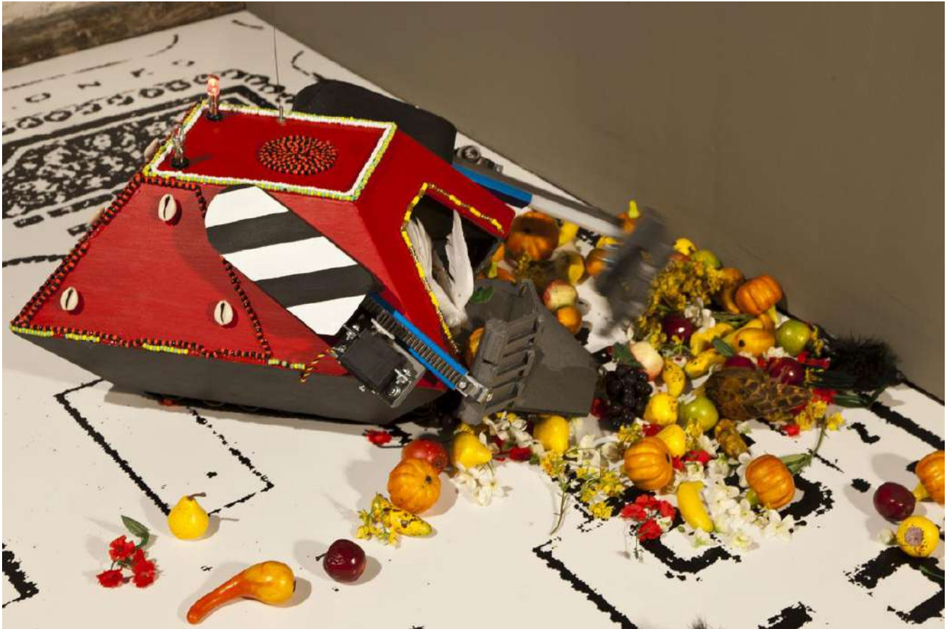
Urban Sarayeye, VAPROR-2059

Vehículo automatizado para la recogida de ofrendas religiosas, 2010 Instalación, Prototipo de robot por control remoto.