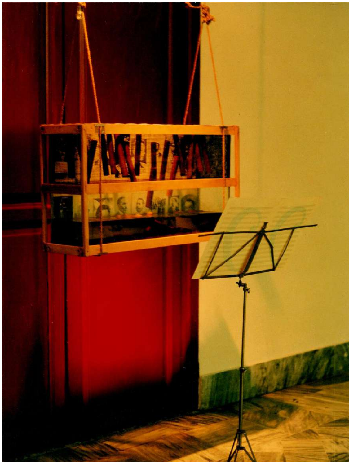
Pianísimo concierto en clave-es de I-fa1997