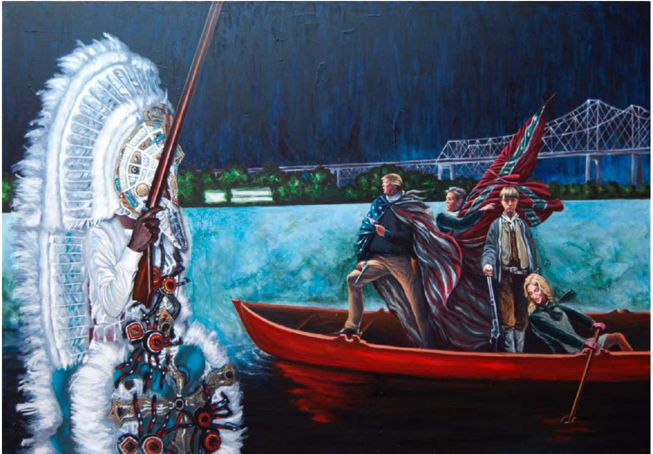
Bajando el Mississippi con Dylann Storm Roof 2017