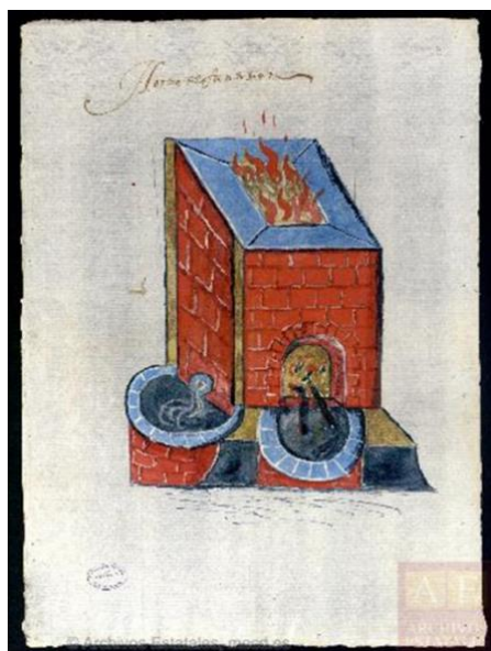
Fig. 2 Horno de fundición, 1621. Archivo General de Indias, MP-INGENIOS, 291

De esta manera, Moya estaba apelando al rey al exponer el valor económico del trabajo realizado por estos esclavizados hábiles, aunque, al mismo tiempo, estaba desafiando las normas instituidas en la península. La respuesta del Consejo de Guerra a Sánchez de Moya se enfocó en la necesidad refinar el cobre enviado a Sevilla con dos fundiciones, dejando entender que podría seguir empleando esclavizados como ayudantes en la fundición de cobre.