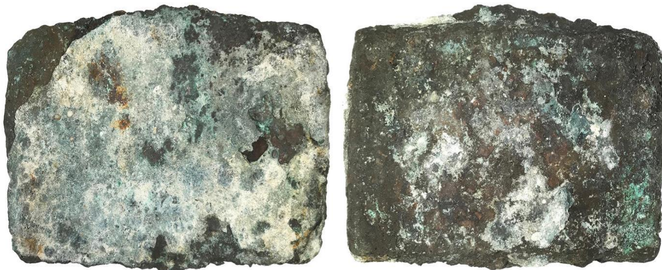
Fig 3. Dos lingotes de cobres provenientes de las minas de Santiago de Cuba y encontrados en naufragio Nuestra Señora de Atocha de 1622. Subasta # 25, lote 312.

mucha cantidad de hierro y margaxita que nace de la mina del cobre que por beneficiarlo mal y fundirlo peor viene con esta malicia” (Información y diligencias).