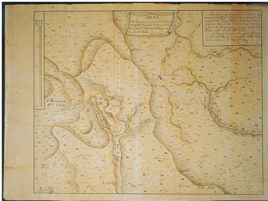
Fig. 4. Plano de las tierras inmediatas al pueblo de Santiago del Prado. Limonta, Isidro, 1767.

del terreno. Esto debido a los crecientes intereses de los terratenientes locales de expandir sus propiedades hacia las tierras reales de las minas. Tierras en las que se localizaban los conucos que pertenecían a los descendientes de los esclavizados africanos.